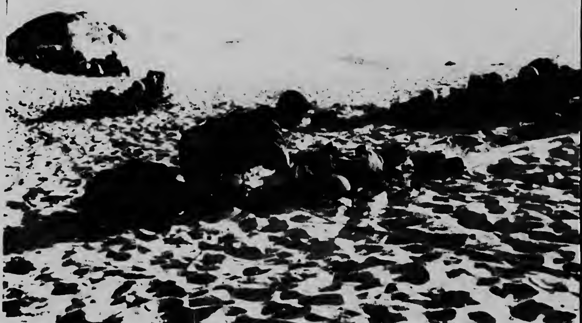
Un dokter qu ta pertenece na un unidad di Cavaleria, aki ta dunando asistencia medico na un compañero qu a ser herida seriamente durante un combate banda di Bong Son na Survietnam. Siman pasá e tropanan norteamericano a sufrí e perdidanan di mas grandi den henter e lucha, ora qu e comunistanan a mata 232 soldá, heridando 1381 y nan a perde soldá.

WILLEMSTAD, -- Diparti di The Young Ones nos a ser informa cu e banda no a kibra manera tin rumornan ta circula ultima- mente den boca di pueblo. E banda te ainda ta den accion y ta gozando di hopi popularidad.